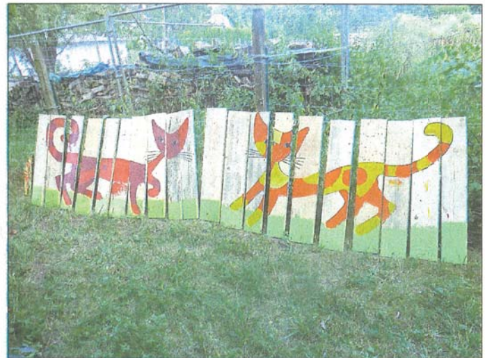
Kreativität entfaltet sich bei der Spielplatzaktion Schön wars!

Ein besonderes Dankeschön geht an die zahlreichen ehrenamtlichen Helferinnen und Helfer und an unsere Kooperationspartner, die einen wichtigen Beitrag geleistet haben, damit Kinder in den Sommerferien eine schöne abwechslungsreiche Zeit miteinander verbringen konnten.