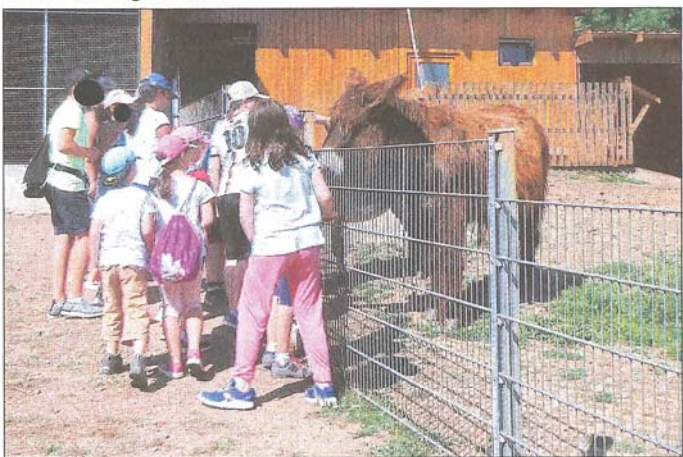
Umwelt- und Freizeitzentrum Finkenrech bei Eppelborn

Das tolle Sommerwetter gab einen wunderbaren Rahmen und egal ob Kochen, Backen, Bauen, Nähen, T-Shirts gestalten, Trommeln, Sport, Wildparkrallye, Walderlebnis, Ausflüge nach Finkenrech, zum Luisenpark nach Mannheim, nach Trier, in den Erlebnispark Tripsdrill oder beim Sommerfest in der Feldstraße - es war für Abwechslung gesorgt. Nur mit einem Angebot kam nicht so recht Freude auf: die Fußball-Klatsche war ja eher als Unterstützung für unser Team gedacht.