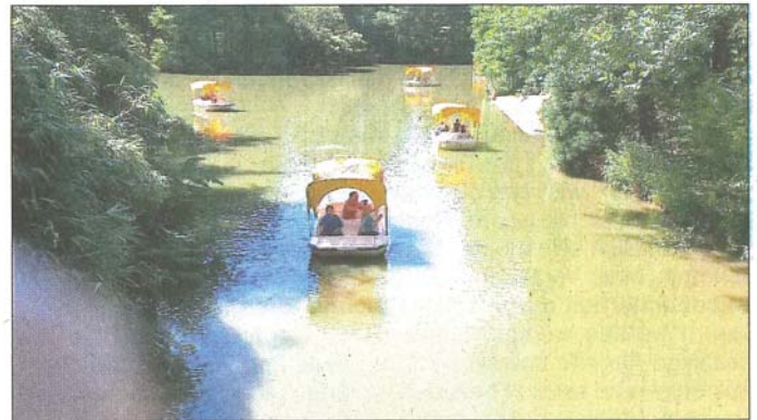
Luisenpark in Mannheim

Alles in allem waren es in diesem Jahr richtig schöne Ferien und die Kinder können jetzt in der Schule ihren Freunden und Freundinnen erzählen, was sie Tolles erlebt und gemacht haben, auch wenn sie aus welchen Gründen auch immer die Ferien „nur“ zu Hause verbracht haben.